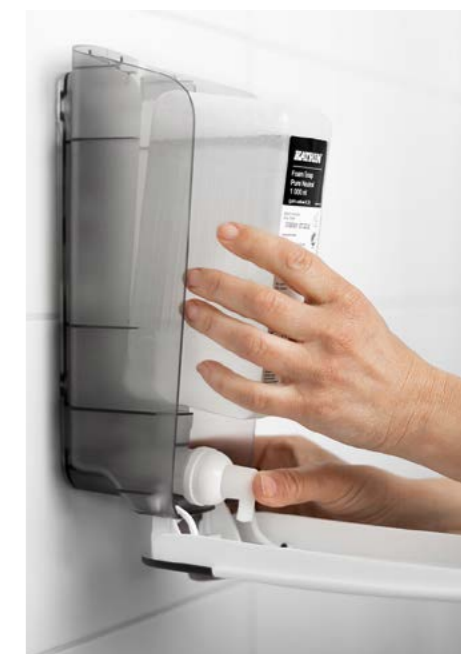
Łatwy do uzupełnienia. Ten sam dozownik może być stosowany do mydła w płynie, mydła w piance, środka do dezynfekcji powierzchni, mydła pod prysznic i środka do dezynfekcji rąk.