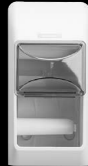
92384 Katrin podajnik do papieru toaletowego w małych rolkach (na 2-rolki) 300 x 145 x 145 mm