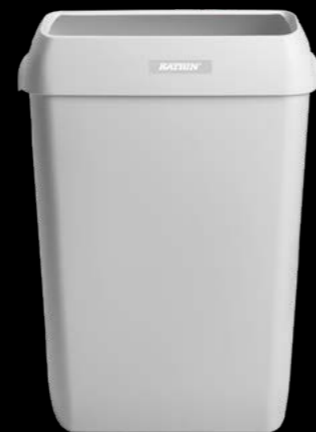
91912 Katrin kosz 50 l 575 x 280 x 420 mm