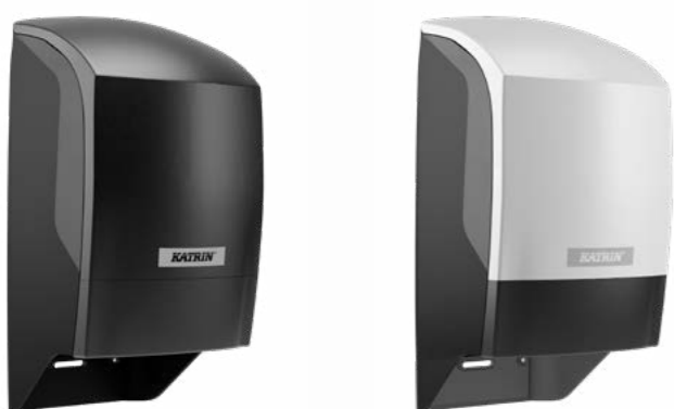
Podajnik do papieru toaletowego Katrin System – czarny i biały