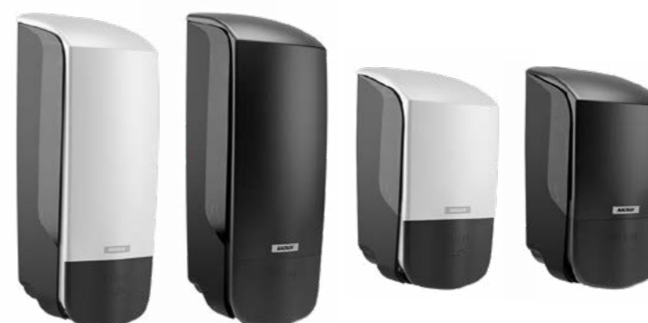
Dozownik jest dostępny w dwóch kolorach i rozmiarach: 1000 i 500 ml.