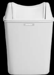
91851 Katrin kosz na odpadki higieniczne 360 x 170 x 240 mm