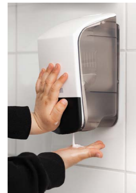
Całkowicie zamknięta powierzchnia nacisku ułatwia korzystanie z dozownika. Dozownik posiada również oznaczenia w języku Braille'a.

DOZOWNIK DO MYDŁA KATRIN ma elegancką, prostą konstrukcję, która pomaga twoim gościom zadbać o doskonałą higienę dłoni. Dzięki przezroczystym bokom personel serwisowy może łatwo sprawdzić, kiedy należy uzupełnić dozownik. Oferujemy różne rodzaje mydła, z których wszystkie są oznaczone symbolem środowiskowym