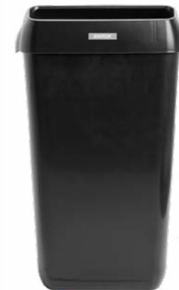
92261 Katrin kosz 50 l 550 x 230 x 330 mm