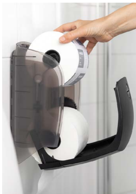
Podajnik można uzupełnić, gdy druga rola jest już w użyciu. Dzięki temu nigdy nie zabraknie papieru toaletowego.