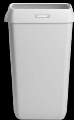
91899 Katrin kosz 25 l 550 x 230 x 330 mm