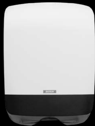
90182 Katrin podajnik Mini na ręczniki składane 350 x 114 x 248 mm