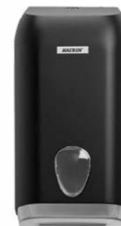
92605 Katrin podajnik do składanego papieru toaletowego 307 x 133 x 158 mm