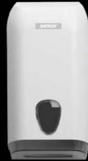
92582 Katrin podajnik do składanego papieru toaletowego 307 x 133 x 158 mm