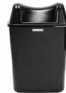
92223 Katrin kosz na odpadki higieniczne 360 x 170 x 240 mm