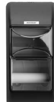
104452 Katrin podajnik do papieru toaletowego w małych rolkach (na 2-rolki) 300 x 145 x 145 mm