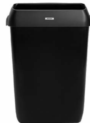
92285 Katrin kosz 25 l 575 x 280 x 420 mm