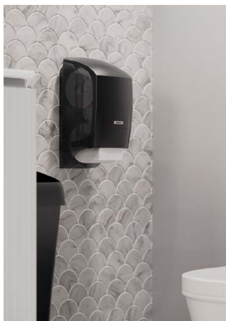
W podajniku jest miejsce na dwie role toaletowe. Gdy jedna rola się skończy, druga automatycznie zajmie swoje miejsce.