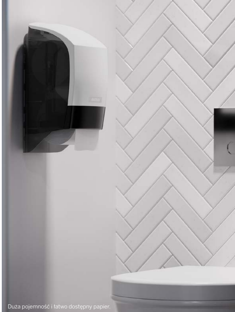
Duża pojemność i łatwo dostępny papier.