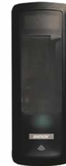
44702 Katrin dozownik bezdotykowy do mydła 117 x 105 x 291 mm