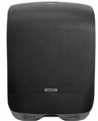
92087 Katrin podajnik Mini na ręczniki składane 350 x 114 x 248 mm