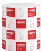
460201 Katrin System M 1 papierové utierky v kotúči pre dávkovač