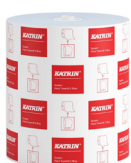
460263 Katrin System M 2 modré papierové utierky v kotúči pre dávkovač