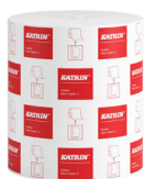
460232 Katrin System L 2 papierové utierky v kotúči pre dávkovač

Medzinárodná ponuka, dostupnosť produktu pre SK nájdete na stránke.