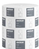
58167 Katrin Plus Dispenser Paper Towel Roll System Medium 2-Ply