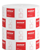
58198 Katrin Dispenser Paper Towel Roll System Medium 2-Ply