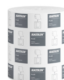
460058 Katrin Plus System M 2 papierové utierky v kotúči pre dávkovač