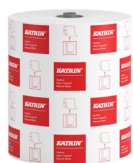
460201 Katrin System Handtuchrolle M 1-lagig