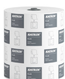
57795 Katrin Plus System Handtuchrolle M 2-lagig

Dieses Datenblatt dient ausschließlich Informationszwecken, für mögliche Fehler oder Ungenauigkeiten wird keinerlei Haftung übernommen. Metsä Tissue behält sich das Recht vor, seine Produkte, Produktinformationen und Produktsortimente ohne vorherige Ankündigung zu ändern.