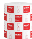
58198 Katrin System Handtuchrolle M 2-lagig