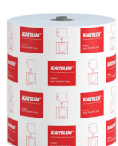
460263 Katrin System Handtuchrolle M 2-lagig, Blau