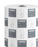
94950 Katrin Plus System Handtuchrolle M 2-lagig