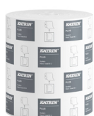
58167 Katrin Plus System Handtuchrolle M 2-lagig