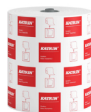
460102 Katrin System Handtuchrolle M 2-lagig