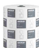
38015 Katrin Plus System Handtuchrolle M 3-lagig