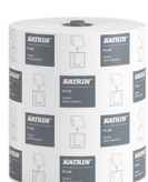
82537 Katrin Plus System Handtuchrolle