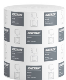
82537 Katrin Plus System Käsipyyherulla M 2-kerroksinen