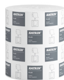
460058 Katrin Plus System Käsipyyherulla M 2-kerroksinen