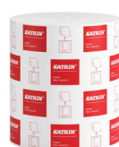
58198 Katrin System Käsipyyherulla M 2-kerroksinen