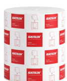
460232 Katrin System Käsipyyherulla L 2-kerroksinen

Kansainvälinen valikoima. Markkinakohtainen saatavuus löytyy tuotesivuilta.