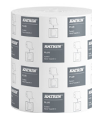
57795 Katrin Plus System Käsipyyherulla M 2-kerroksinen