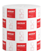
460102 Katrin System Käsipyyherulla M 2-kerroksinen