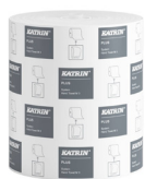
38015 Katrin Plus System Käsipyyherulla M 3-kerroksinen