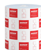
460263 Katrin System Käsipyyherulla M 2-kerroksinen, Sininen