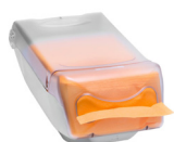
962045 Katrin Serviettenspender

Beispielhafte Auswahl aus allen Ländern. Die Verfügbarkeit für einzelne Regionen finden Sie auf der Webseite.