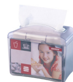
22564 Katrin Serviettenspender