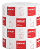
460102 Katrin System Käsipyyherulla M 2-kerroksinen