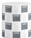
38015 Katrin Plus System Käsipyyherulla M 3-kerroksinen