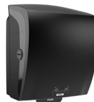
82070 Katrin System