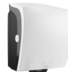
82094 Katrin System