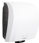
40735 Katrin System