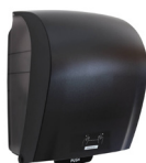
40711 Katrin System

Beispielhafte Auswahl aus allen Ländern. Die Verfügbarkeit für einzelne Regionen finden Sie auf der Webseite.