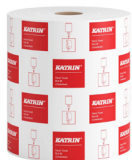
485049 Katrin Vetopyyhe M 1-kerroksinen

Kansainvälinen valikoima. Markkinakohtainen saatavuus löytyy tuotesivuilta.