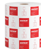
481903 Katrin Vetopyyhe M 2-kerroksinen Laminoitu