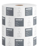
64403 Katrin Plus Vetopyyhe M 1-kerroksinen