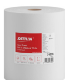
74526 Katrin Vetopyyhe M 2-kerroksinen, Luonnonvalkoinen