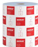
464414 Katrin Vetopyyhe M 2-kerroksinen Laminoitu, Sininen