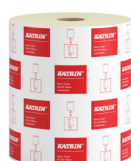
463966 Katrin Vetopyyhe M 1-kerroksinen, Keltainen