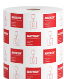
481911 Katrin Vetopyyhe M 2-kerroksinen