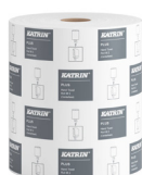
55227 Katrin Plus Vetopyyhe M 2-kerroksinen