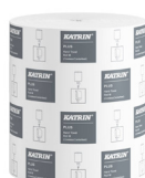
475355 Katrin Plus Vetopyyhe M 1-kerroksinen Hylsytön