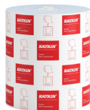
460218 Katrin Dispenser Paper Towel Roll System Medium 1-Ply, Blue