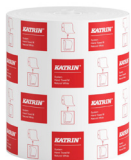
460201 Katrin System M 1 papierové utierky v kotúči pre dávkovač