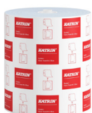
460263 Katrin System M 2 modré papierové utierky v kotúči pre dávkovač