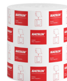
460102 Katrin Dispenser Paper Towel Roll System Medium 2-Ply