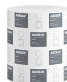
460058 Katrin Plus System M 2 papierové utierky v kotúči pre dávkovač