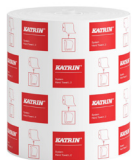
460232 Katrin System L 2 papierové utierky v kotúči pre dávkovač

Medzinárodná ponuka, dostupnosť produktu pre SK nájdete na stránke.