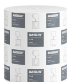
38015 Katrin Plus Dispenser Paper Towel Roll System M 3-Ply