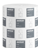
38015 Katrin Plus System Handtuchrolle M 3-lagig