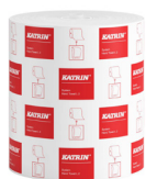
460232 Katrin System Handtuchrolle L 2-lagig

Beispielhafte Auswahl aus allen Ländern. Die Verfügbarkeit für einzelne Regionen finden Sie auf der Webseite.