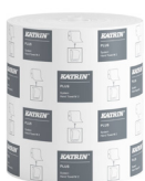
57795 Katrin Plus System Handtuchrolle M 2-lagig