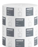
58167 Katrin Plus System Handtuchrolle M 2-lagig