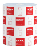
460218 Katrin System Handtuchrolle M 1-lagig, Blau