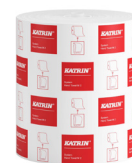
460102 Katrin System Handtuchrolle M 2-lagig