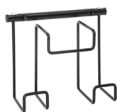
54961 Katrinn Hållare till Torkdukar